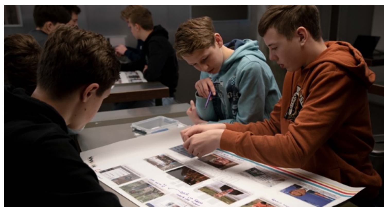
Een mediawijze samenleving is nu belangrijker dan ooit

Binnenkort bieden wij ook de Masterclass Journalistiek en Democratie aan. In deze Masterclass gaan we met scholieren en studenten in gesprek over journalistiek in onze samenleving. Hoe wordt hun oordeelsvorming beïnvloed door (sociale) media? Welke rol speelt de journalistiek hierin? Is het de taak van journalisten om onze democratische waarden te beschermen? Deze vragen (en meer) komen aan bod tijdens de nieuwe Masterclass en is binnenkort te boeken voor jouw klas.