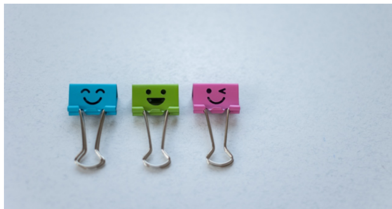
Complimenten in de klas

Na een vakantie weer de klas in kan best even wennen zijn. Tijd voor een oefening om weer in verbinding met elkaar te komen. Geef alle leerlingen/studenten een A4 om achter op hun rug te plakken. Laat ze vervolgens door de klas lopen en complimenten op elkaars rug schrijven. Aan het eind van het spel, kan iedereen een blad vol complimenten mee naar huis nemen.