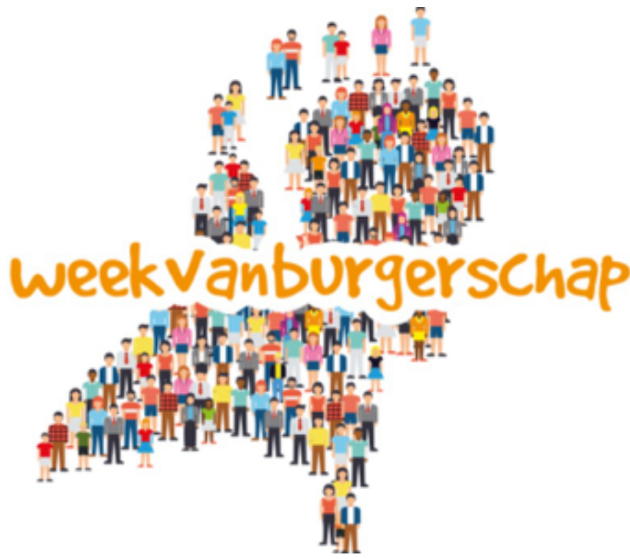
Van 22 tot en met 26 mei is het de Week van Burgerschap

Van 22 tot en met 26 mei is het de Week van Burgerschap. Het moment om stil te staan bij het burgerschapsonderwijs op jouw school. Dit jaar is het thema veiligheid. Aan de slag met dit thema? Op onze pagina vind je videofragmenten over vrijheid en feminisme en videofragmenten en een lesbrieff over online privacy , waarmee je op een laagdrempelige manier het gesprek aangaat over veiligheid. Liever een ander thema bespreken in de les? Bekijk ons gehele gratis aanbod van video's en lesbrieffen.